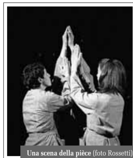
Una scena della pièce (foto Rossetti)

Il risultato segue questo percorso di avvicinamento e apertura. Nello spazio antistante la balaustra della chiesa del monastero di via Locatelli, tre attrici (la stessa Magri, anche regista, con